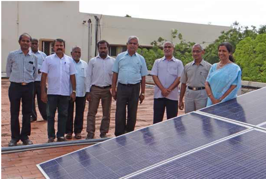
Institute Director and others during the inaugural function

More than three decades after passing out of the institute, students of the 1980-batch of the National Institute of Technology, Tiruchy (then known as the Regional Engineering College) have come together to gift their alma mater a solar power system.