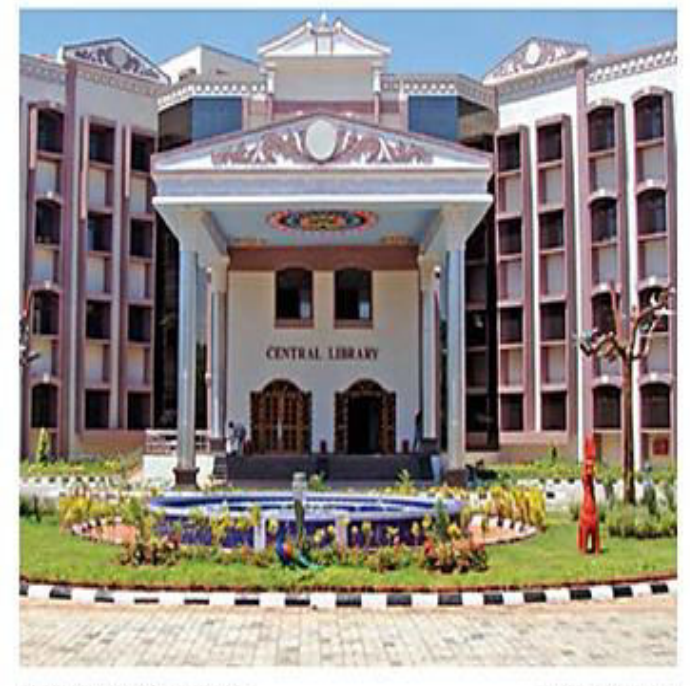
NIT Tiruchy campus

The 'SIH 2018' will comprise two segments - the Software Hackathon and, from this edition, the Hardware Hackathon (SIHH), says the release. Seven teams have been shortlisted for the 'grand finale' and each team will be supported by mentors from NIT-Tiruchirappalli who will help in making edited versions of the prototype.