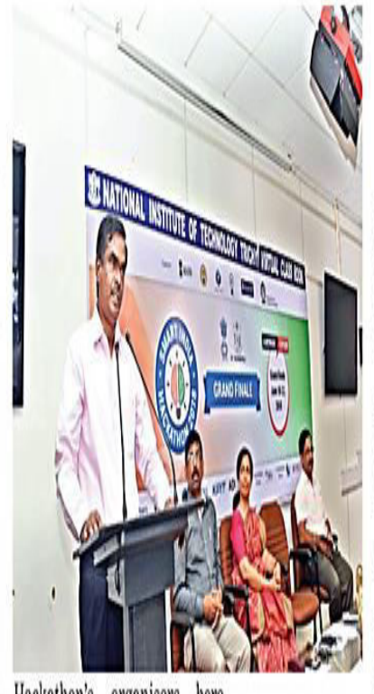
to come up with a working Hackathon's organisers here. In her welcome address.

The six teams, drawn from Nagpur, Coimbatore, Pune, Hyderabad, Udaipur, and Chittoor, would be slogging round-the-clock prototype by June 22, the told DC correspondent