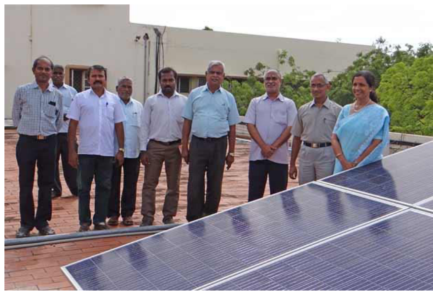
Institute Director and others during the inaugural function

More than three decades after passing out of the institute, students of the 1980-batch of the National Institute of Technology, Tiruchy (then known as the Regional Engineering College) have come together to gift their alma mater a solar power system.